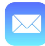
Apple (iOS) Email

Grundsätzlich sind die notwendigen Zugangsdaten für alle Plattformen gleich. Zur Erstellung Ihres E-Mail Kontos auf Ihrem Endgerät (PC, Laptop, Tablet oder Smartphone) nutzen Sie bitte die Einrichtungsassistenten der jeweiligen Programme. Beim E-Mail Abruf unterscheidet man zwischen dem POP Dienst und dem IMAP Dienst. Der POP Dienst ruft die E-Mail vom Server ab und speichert sie lokal auf dem Gerät. Auf Wunsch kann eine Kopie der Nachricht auf dem Mailserver belassen werden. Der IMAP Dienst stellt lokal ein Abbild des Mailservers dar. Alle Änderungen werden mit dem Mailserver synchronisiert. Die Originalnachrichten verbleiben bis zur Löschung auf dem Mailserver. Dieser Dienst richtet sich vor allem an Nutzer, die ihre E-Mails auf mehreren Geräten bearbeiten. Im Folgenden werden die Unterschiedlichen Konfigurationen, wenn nötig separat abgebildet.